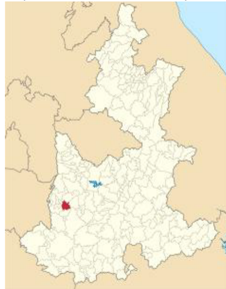
Mapa 1. Ubicación del municipio